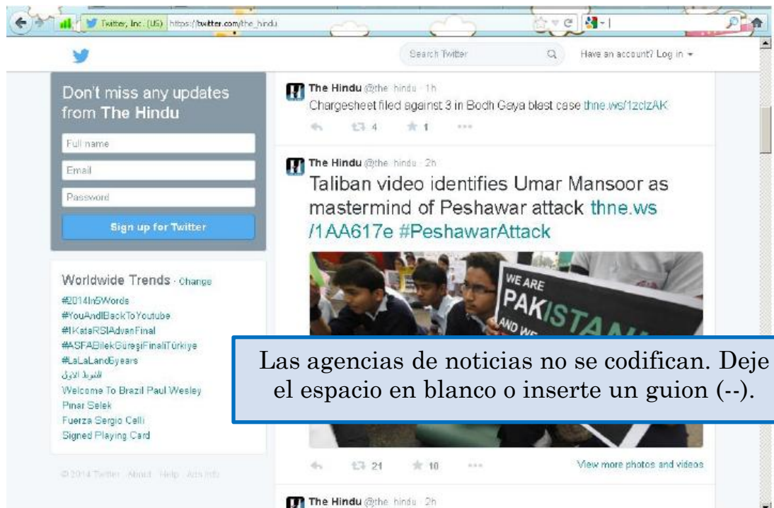
HOJA DE CODIFICACIÓN PARA TWITTER

Haga clic en el hyperlink que lo lleva a la nota original en el sitio web de The Hindu. Allí se observa que la nota la publicó la agencia de noticias Reuters.