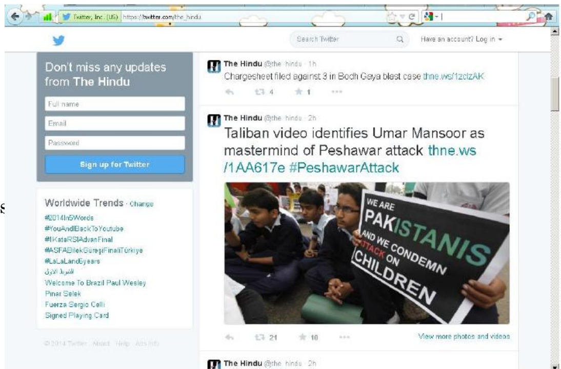
HOJA DE CODIFICACIÓN PARA TWITTER