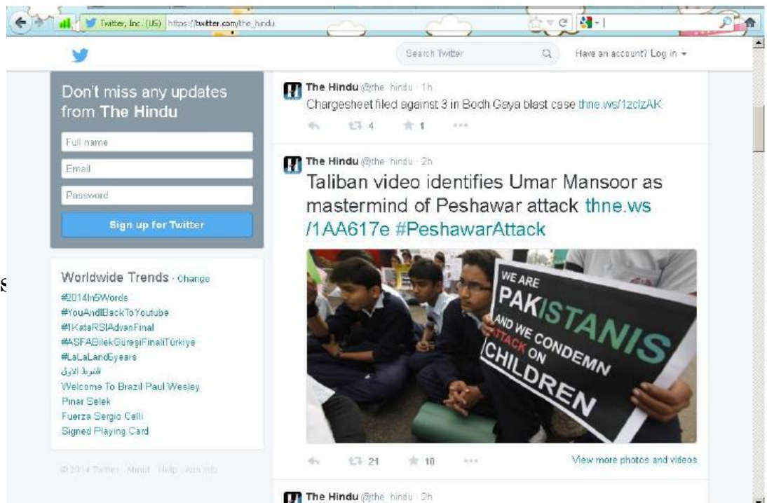
HOJA DE CODIFICACIÓN PARA TWITTER