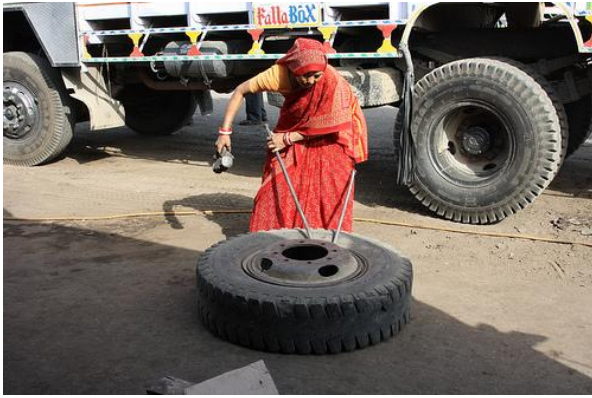
Galardonada en la WACC's Photo Competition, 2009