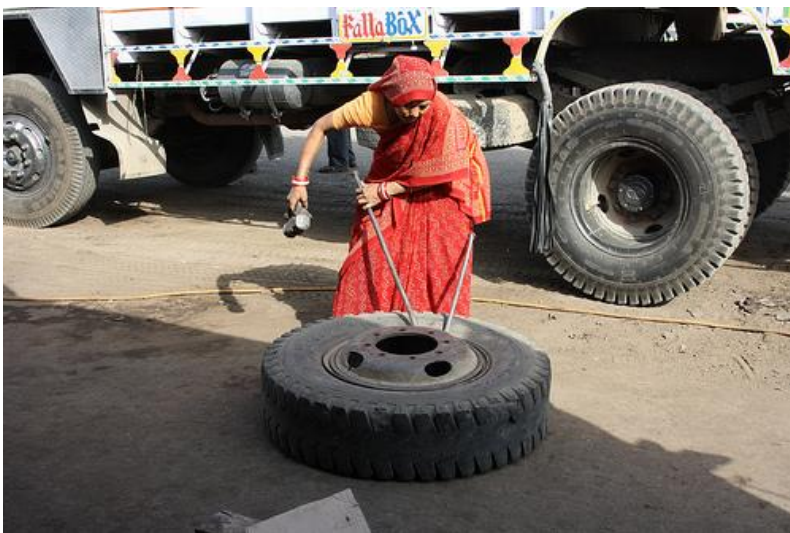
Galardonada en la WACC's Photo Competition, 2009