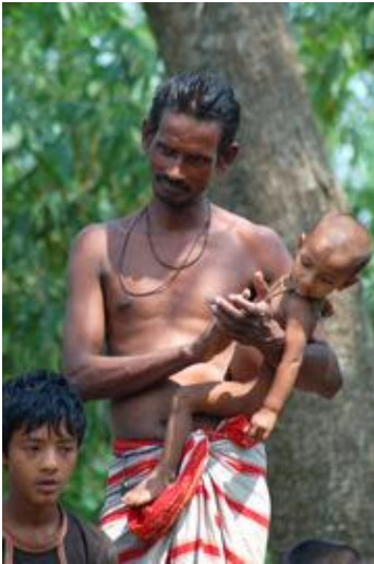
Foto Heather Plett. Galardonada en la WACC's Photo Competition, 2009

Notas que desafían estereotipos incluyen aquellas que dan un vuelco a los supuestos que comúnmente se tienen con respecto a las mujeres y los hombres en relación con sus atributos, sus competencias, intereses, etcétera. Por ejemplo, una nota donde mujeres con conocimientos en un área discuten políticas económicas u otra nota sobre enfermeros. Otras notas podrían desafiar estereotipos de formas más complejas, por ejemplo, una que aborde las preferencias electorales podría echar por tierra la percepción que las mujeres son uniformes políticamente. Las notas que desafían los estereotipos generalmente introducirán nuevas formas de pensar ciertas temáticas, ofreciendo nuevos ángulos y perspectivas. El lenguaje (selección de palabras) y las imágenes (selección de fotografías) en la noticia o artículo te ayudará a decidir qué código usar. Si no está segura/o, o no puede decidir, codifique 4.