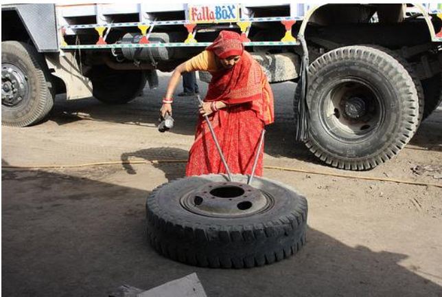
Galardonada en la WACC's Photo Competition, 2009